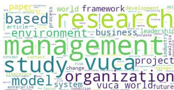
Figura 4. Nube de palabras del grupo 10

Existen varias dificultades asociadas al uso de este tipo de análisis, y corresponde a la dependencia de algoritmos de filtrado o preprocesamiento de palabras, y el set de datos utilizados. El filtrado presenta problemas cuando existen palabras propias del conjunto de datos que no agregan contenido, tal como las palabras "paper" y "research" que no aportan más información al análisis posterior. La eliminación de estas palabras fue discutida por el equipo, porque no existen criterios definidos en procesamiento de texto para definir cuándo una palabra puede ser incluida en la lista de "stopwords" (Dolamic y Savoy, 2010). Por otro lado, la combinación con el algoritmo K-Means podría ayudar a analizar un grupo tan grande como el grupo 10, pero a medida que los grupos disminuyen de tamaño, no encontramos coherencia en los grupos propuestos. Los problemas asociados al set de datos se reportaron en Fuentealba y otros (2021), porque métodos como K-Means pueden verse afectados cuando el set de datos es muy pequeño, o cuando el contenido de cada documento es corto. Una de las posibles razones de este efecto, viene dada por la entropía que puede generar el lenguaje al expresar ideas similares (Vera y otros, 2021). Por este motivo, se considera imprescindible reali-