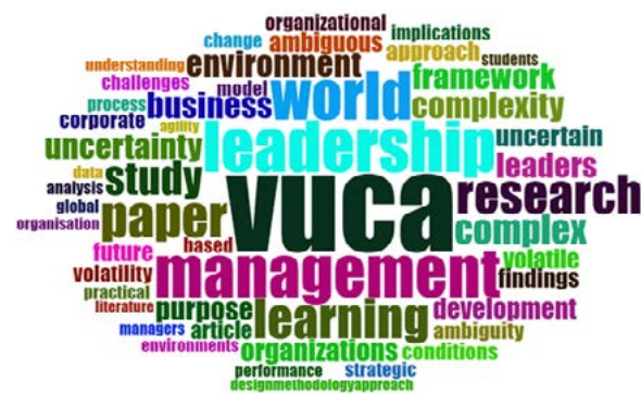
Figura 3. Nube de palabras de los Abstracts

La figura 3 muestra una nube de palabras de los 95 resúmenes seleccionados. La nube de palabras ilustra que VUCA es la palabra principal, seguida de gestión y liderazgo.