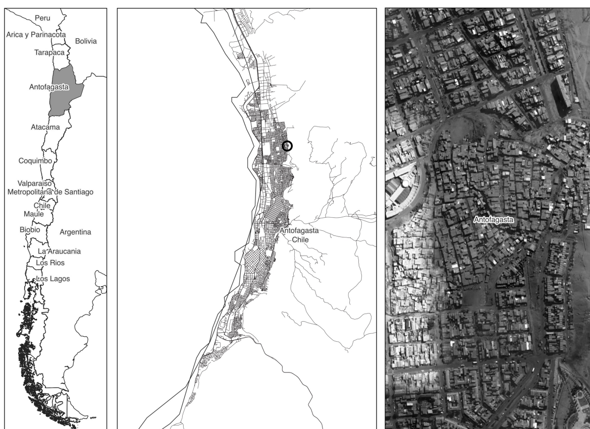
Figura 1. Macrocampamento Los Arenales en la ciudad de Antofagasta

El espejismo chileno se mantuvo por décadas, debido al crecimiento económico basado en la explotación extractivista de bienes naturales, especialmente mineros (Arias, Atienza, & Cademartori 2014; Phelps, Atienza, & Arias 2015). Chile es el país con la mayor producción, exportación y reservas de cobre mundial, y posee alrededor del 42% de las reservas globales de litio (USGS 2022). Tal explotación se concentra en la Región de Antofagasta, localizada en el árido Desierto de Atacama (ver Figura 1), también considerada como ejemplo de desarrollo basado en la minería (CEPAL 2009; OECD 2013). La percepción internacional de bonanza ha atraído a