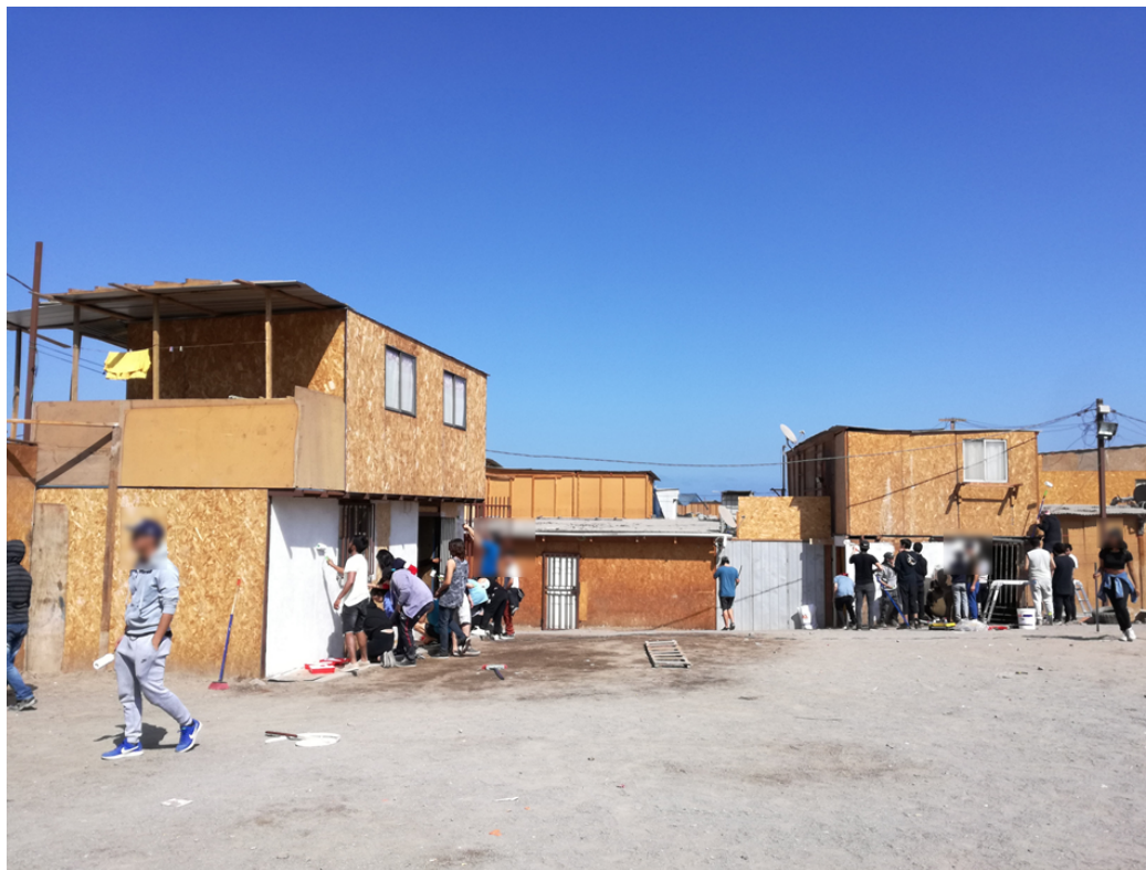
Figura 5. Preparación de las fachadas de madera prensada