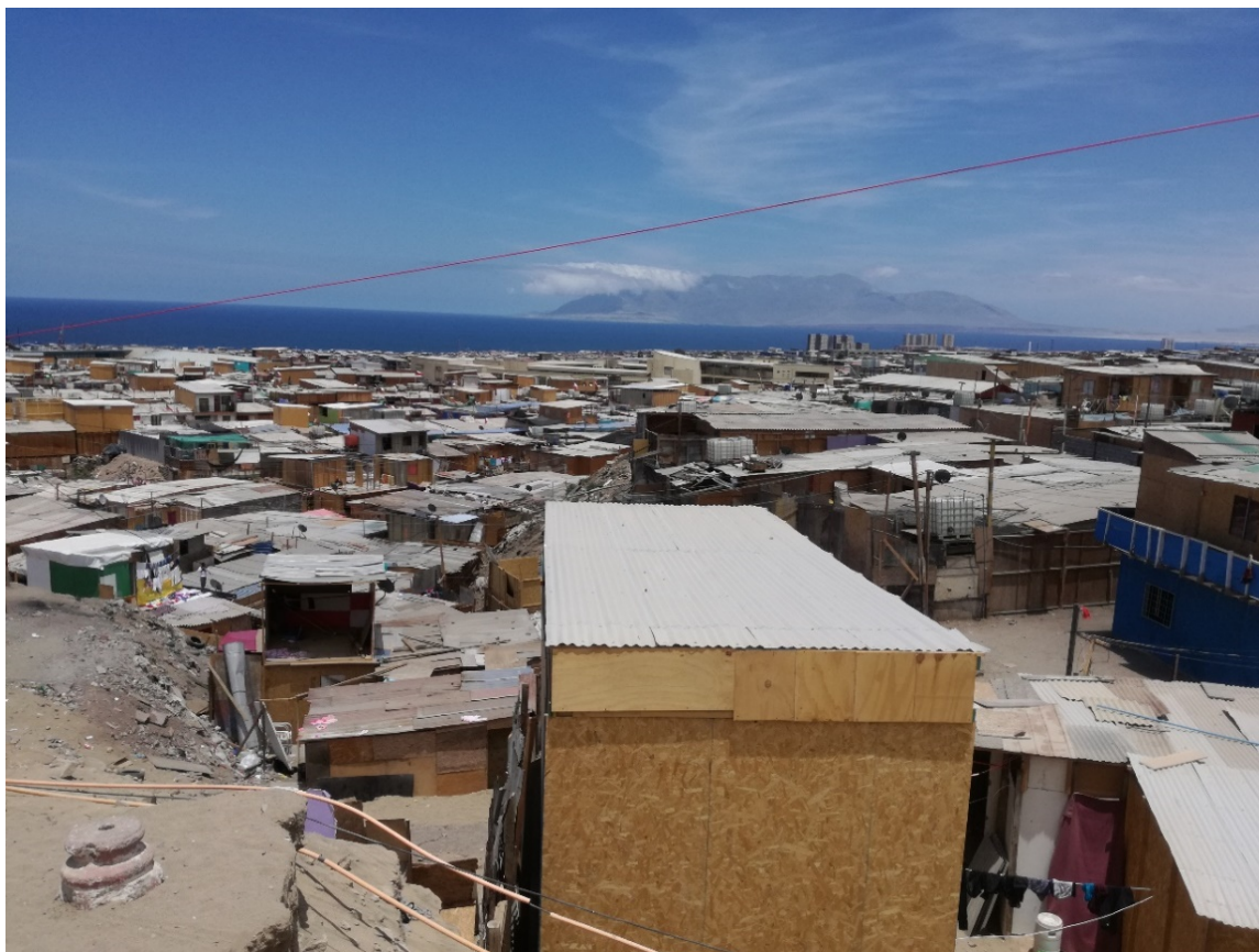
Figura 3. Vista del Macrocampamento Los Arenales