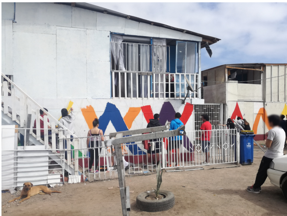
Figura 6. Pintado en curso