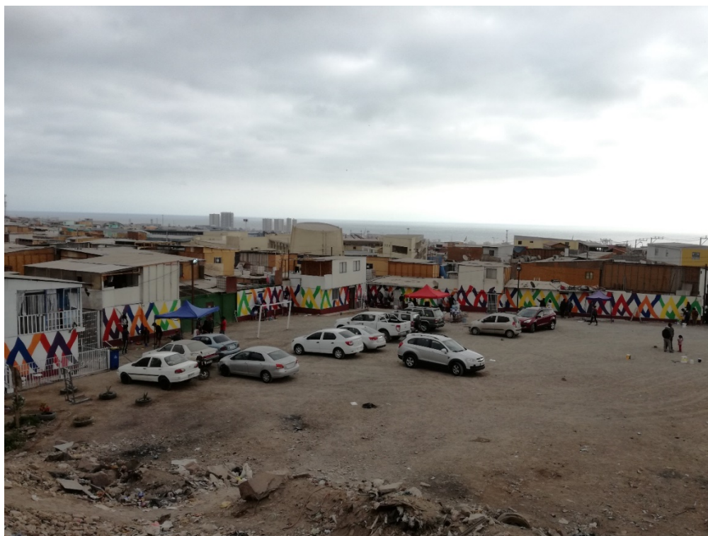
Figura 7. Pintado finalizado