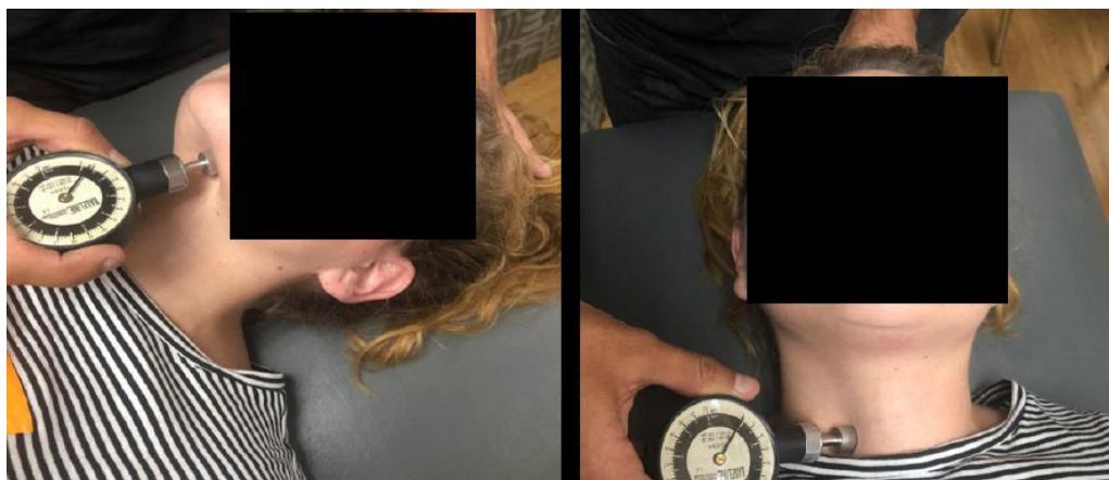
Figura 2. Aplicación del algómetro de presión en la región central del vientre anterior del digástrico (a izquierda) y en la región tirofaríngea (a derecha).

A medida se encontró cada uno de los puntos indicados, se posicionó el cabezal del algómetro de forma perpendicular y se ejerció presión hasta que el individuo comenzara a sentir dolor (figura 2). Tan pronto la sensación de presión dejara de ser indolora, la participante debió levantar su mano derecha como forma de aviso –momento de reconocimiento del umbral de dolor de cada estructura (Pelfort et al., 2015)–.