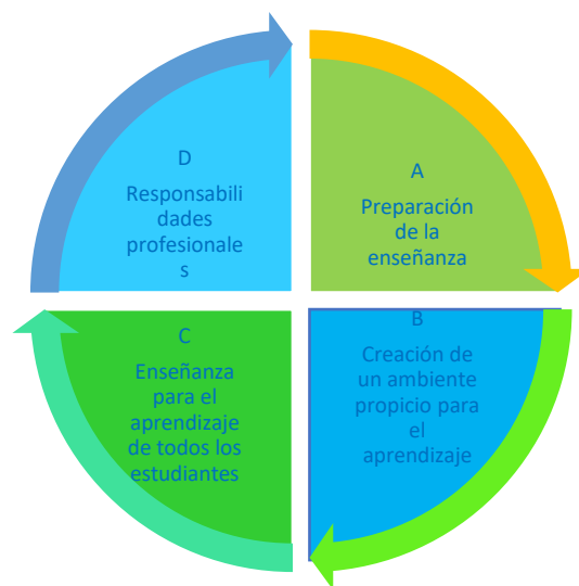
Figura 1. Ciclo del aprendizaje. Tomado del Marco para la Buena Enseñanza (2021)