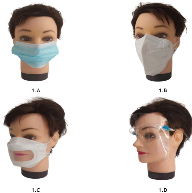
Figura 1. Características de las mascarillas utilizadas en la medición del L_{eq} .

1.D. Escudo facial: Polietileno Tereftalato (PET). Protección de aislamiento fácil de 180°. Dimensiones: 32cm x 22cm con un espesor de lámina de 0,23 mm.